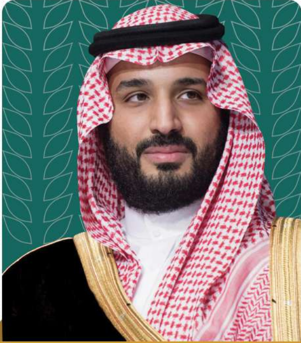
صاحب السمو الملكي

الأمير محمد بن سلمان بن عبدالعزيز آل سعود